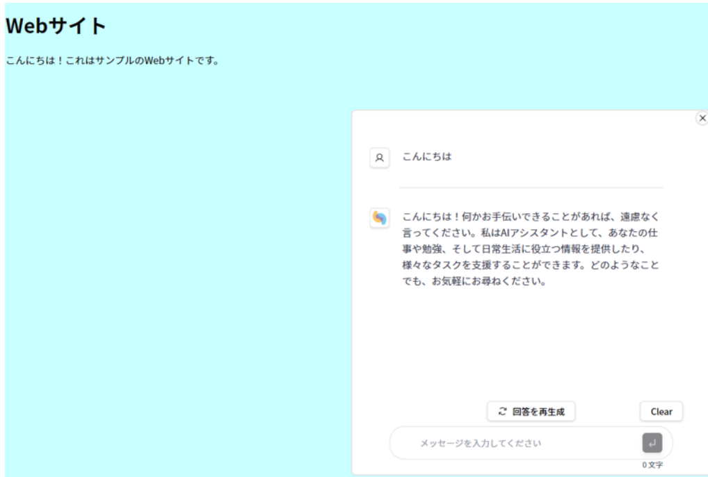
チャットUIの組み込みイメージ